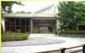
県立民俗博物館(大和郡山市)