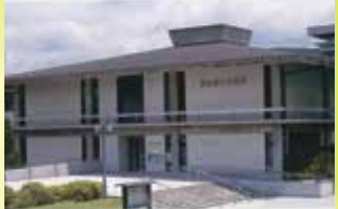
県立美術館(奈良市)