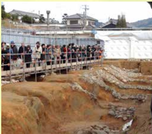
発掘現場説明会(明日香村小山田遺跡)

歴史を肌で感じていただけるよう、文化資源の調査、保存や発掘現場の積極的な公開などに取り組んでいきます。