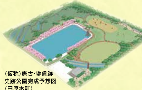
(仮称)唐古・鍵遺跡史跡公園完成予想図(田原本町)

文化財を保存・整備・活用するための補助制度や、史跡等の整備を行う市町村への補助金を設けています。史跡等を生かした文化・観光の活性化などに向けた取り組みが進められています。