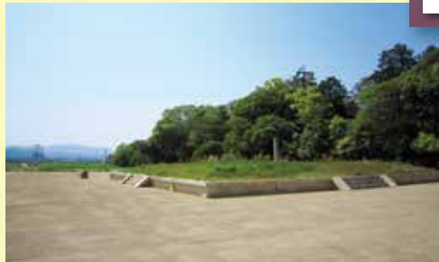
整備が進む大安寺旧境内(奈良市)