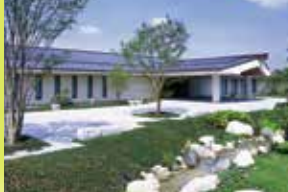
県立万葉文化館(明日香村)