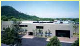
県立橿原考古学研究所附属博物館(橿原市)