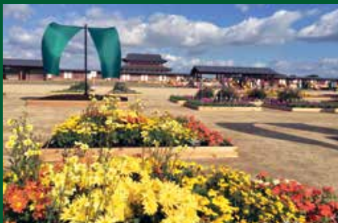
平城京天平祭・秋2014のようす