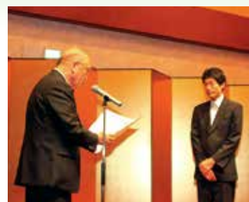
昨年の表彰式のような 受賞事業所:奈良積水株式会社 (旧社名 立積住備工業株式会社)