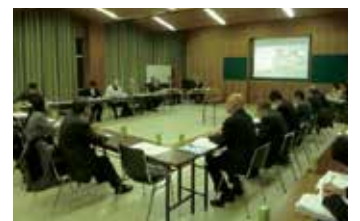
まちづくり検討会のようす

市の玄関口として、地域住民、協議会とともに駅前ビルの再生や空き家の利活用、まち並み景観を活かした賑わいづくりを進めます。