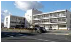
旧県桜井総合庁舎