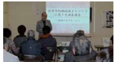
景観まちづくりの会のようす

長谷寺を中心にまちおこしを図り、地域住民、NPOとともに門前通りのまち並み景観を活かした観光振興、地域活性化を目指します。