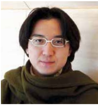
建築家・デザイナー・ファシリテーター 株式会社イチバンセン 代表取締役 nextstations共同代表