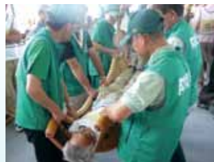
避難所での簡易担架訓練

また、大和高田市総合福祉会館では、自主防災組織や住民の参加による避難所開設・運営訓練や避難所医療訓練を行いました。