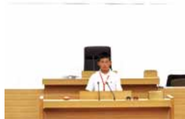
就任挨拶をするこども知事