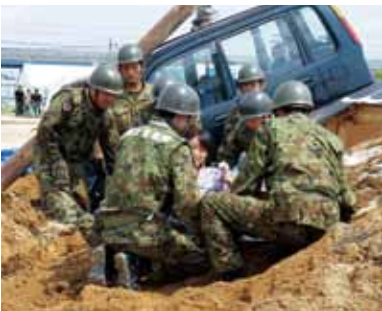
倒壊建物・埋没車両からの救出訓練

今年度は、地域住民、警察、消防、自衛隊、ライフライン機関及び医療関係機関などの73団体、約1,200人が参加し、大規模地震を想定した実践型の訓練を実施しました。