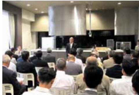
知事式辞(実践バンケット)

施設見学会では、吉野杉や檜をふんだんに使用した上質で温もりある客室を見学し、多くの参加者が大和平野を見渡す素晴らしい眺望に感嘆の声を上げていました。また、奈良県産食材を使用した料理を試食いただき、大学校が目指す「食」と「農」の接続についてPRRを行いました。