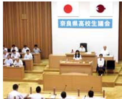
質問する高校生議員

8月20日、今年で4回目となる高校生議会が開かれました。県内6つの高校から26人の「高校生議員」が参加し、奈良県のスポーツ施設の施設や観光客の誘致、吉野材の活用策、さらに、奈良盆地の南部における魅力発信方法など14の質問をしました。また、奈良県の文化を通じた子育てしやすい環境づくりや農業と医療が連携した地域づくりなど6つの提言も行われ、全て満場一致で可決されました。