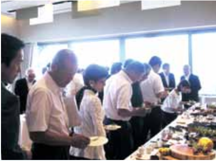
県産食材を使用した料理の試食(ダイニングルーム)

実践オーベルジュ棟は、40席のフランス料理レストラン、9室の宿泊室、実践バンケット(ステーキキッチン付き)の研修室を備えており、