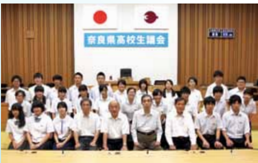
奈良県政への質問・提言を行った高校生議員たち

その後、「若者の政治への参加」をテーマに、議員体験の感想などについて、県議会議員と意見交換が行われました。