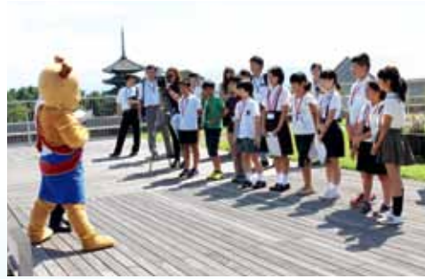
魅力あふれる奈良の説明を受けるこども知事

その後、荒井知事と奈良の食材を使ったお弁当で会食。さらに県の施策などに関する説明を受けたり、せんとくんと交流したりと県庁でさまざまな体験をしました。