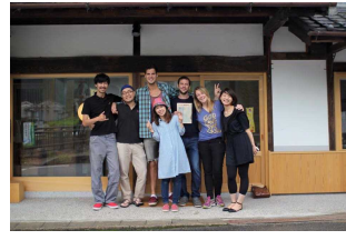
(オフィスキャンプ東吉野)

(村HPアドレス) http://www.vill.higashiyoshino.nara.jp/