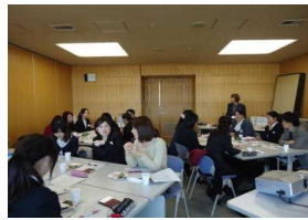
(2~3年目先輩保健師交流会)