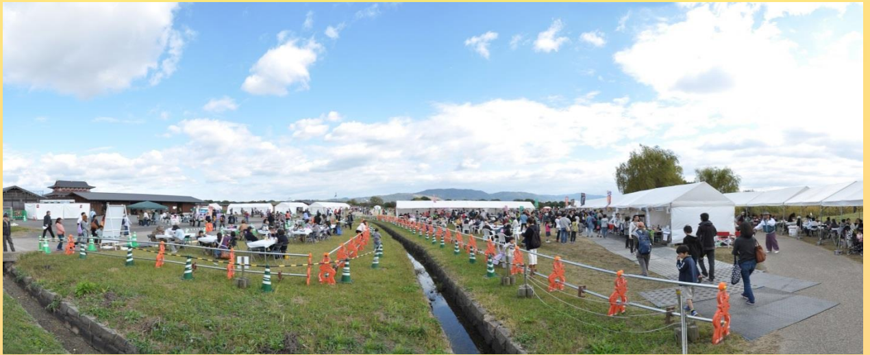
キッチンカーコーナー