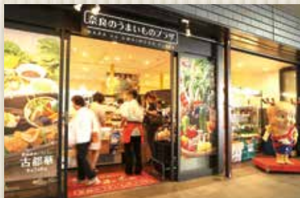
JR奈良駅構内1階にある「奈良のうまいものプラザ」

併設のレストラン「古都華」では、新鮮野菜を味わえる「野菜バイキング」など、県産食材をふんだんに使った料理を提供しています。