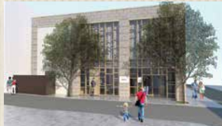
ときのもり外観イメージ

ブランド力の向上を目的として、1月に東京都白金台に、レストランとショップの複合施設「ときのもり」をグランドオープンします。