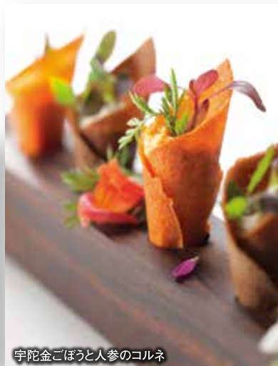
宇陀金ごぼうと人参のコルネ

今年9月、桜井市にオープンした「オーベルジュ・ド・ぷれざんす 桜井」。連日、県内外から多くの人々が訪れています。 クリスマス期間は、中庭のイルミネーションのあかりと共に、奈良の「おいしい食」をお楽しみいただけます。