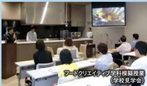
フードクリエイティブ学科模擬授業 (学校見学会)