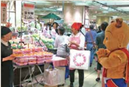
高島屋横浜店でのPRフェアのようす

首都圏の百貨店等で、県産農産物や加工品の販売等を行い、奈良の「食」の知名度アップを目指しています。