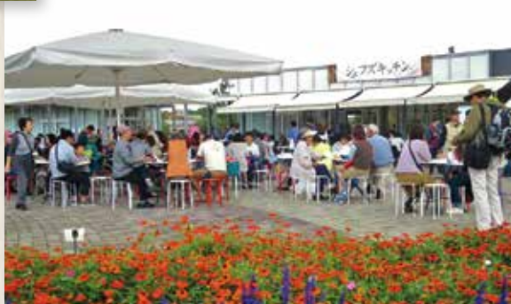
馬見丘陵公園では「シェフェスタin馬見」として、「馬見フラワーフェスタ」と同時開催。花や音楽とともにおいしい食事を味わうことができます。

「シェフェスタ」を介して生産者、料理人、消費者の交流が生まれています。その繋がりをさらに発展させ、「食」で奈良の魅力を広く発信していきたいです。