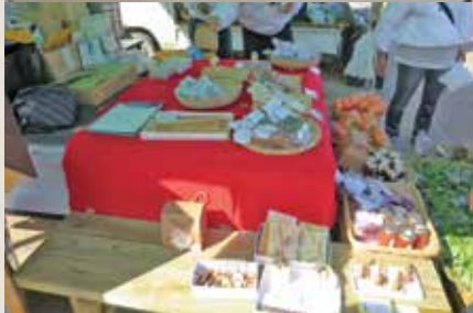
天理駅前で開催したマルシェのようす