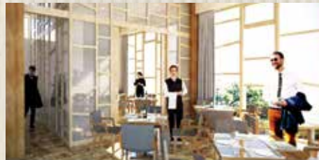
レストランイメージ