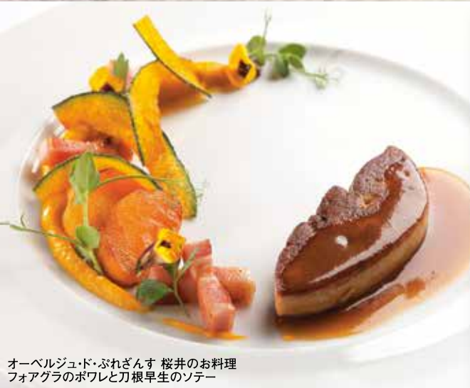
オーベルジュ・ド・ぶれざんす 桜井のお料理 フォアグラのポワレと刀根早生のソテー