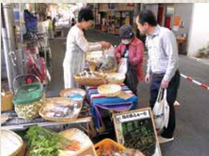
御所駅周辺で開催したマルシェのようす

市町村と連携し、主要駅の駅前で、県産農産物や加工品を生産者が直接販売するマルシェを開催しています。