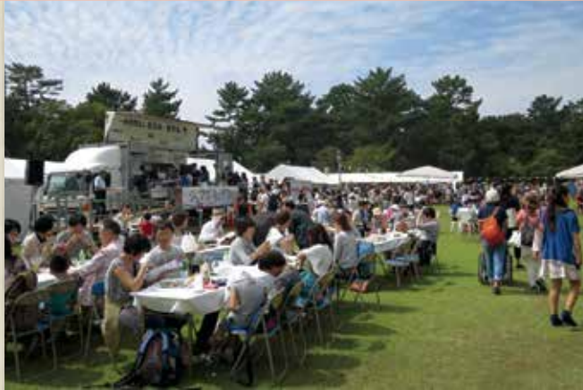
奈良公園登大路園地では「シェフェスタin奈良」として開催。広い公園の中でゆったりと食事を楽しむことができます。

「奈良フードフェスティバル」。 県産食材のPRや、レストランのシェフと生産者の交流を図っています。