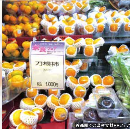
首都圏での県産食材PRフェア

「食」には、健康を支え、人を集める力があり、食を通じて地域の魅力発信は、インパクトのある地方創生にもつながります。 奈良県には、大和野菜をはじめ、おいしい食材がたくさんあります。県では、県産食材レストランの開設、担い手の育成、フードフェスティバルの開催や首都圏へのPRなど、奈良の「おいしい食」のさらなる創造・発信に取り組んでいます。