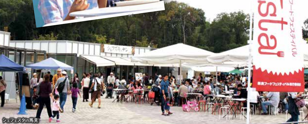
シェフェスタin馬見