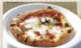
一流シェフのオリジナル料理が味わえる「シェフズキッチン」のほか、「青空ピッツア」やマルシェ等も充実。