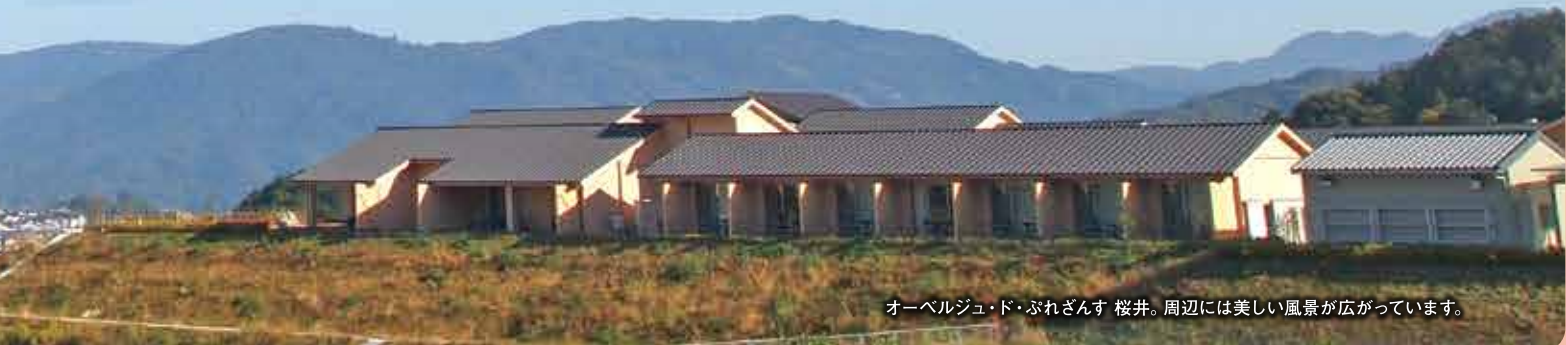
オーベルジュ・ド・ぶれざんす 桜井。周辺には美しい風景が広がっています。

「食」には、健康を支え、人を集める力があり、食を通じて地域の魅力発信は、インパクトのある地方創生にもつながります。 奈良県には、大和野菜をはじめ、おいしい食材がたくさんあります。県では、県産食材レストランの開設、担い手の育成、フードフェスティバルの開催や首都圏へのPRなど、奈良の「おいしい食」のさらなる創造・発信に取り組んでいます。