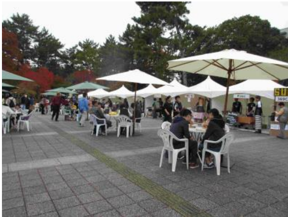
健康カフェ・奈良マルシェ