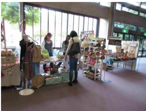
クラフト体験セミナー