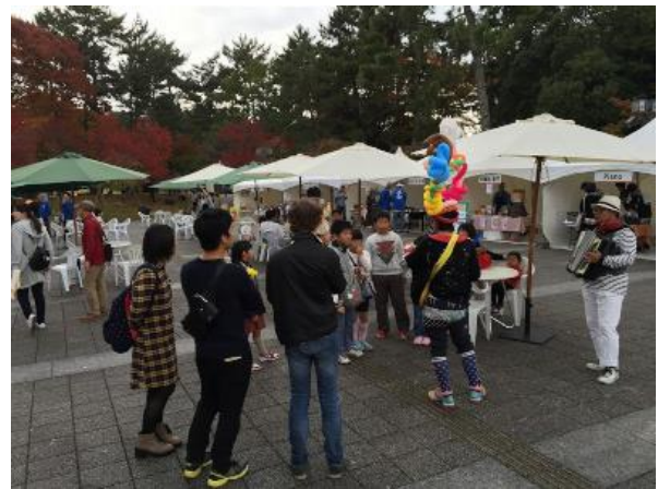
大道芸パフォーマンス