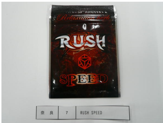
(7) RUSH SPEED