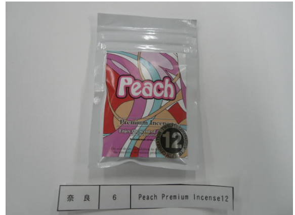
(6) Peach Premium Incense 12