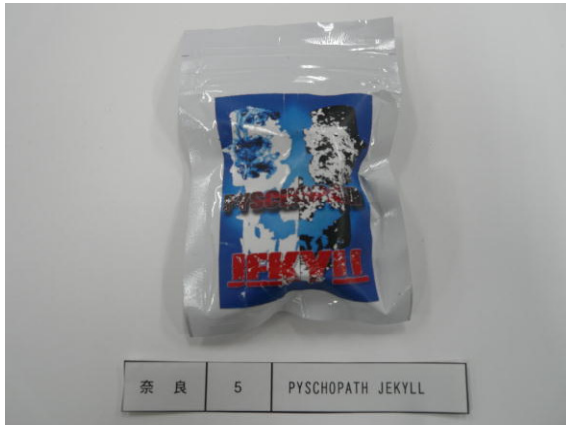
(5) PSYCHOPATH JEKYL