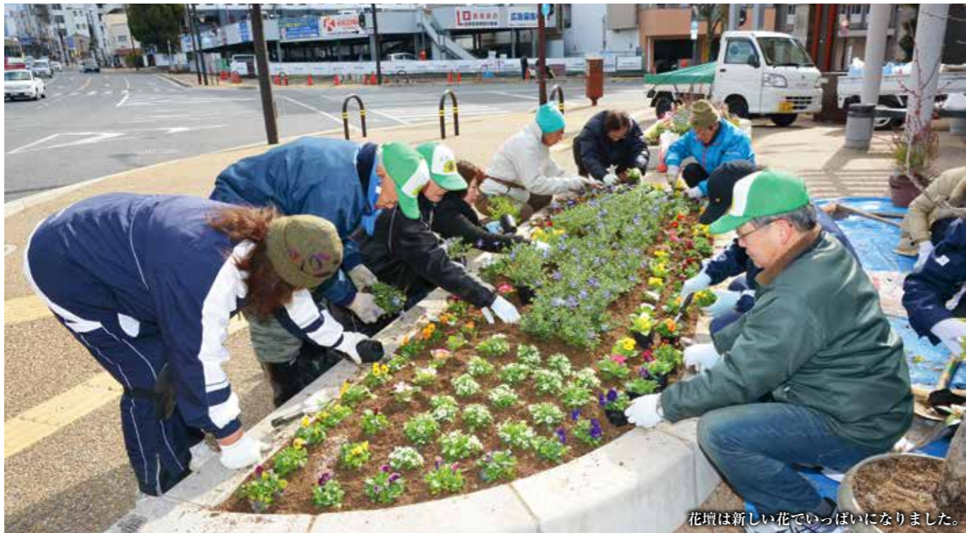
花壇は新しい花でいっぱいになりました。