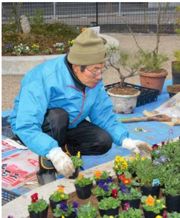
大宮通りをきれいに。そして他の地域にも…。

大宮通りをきれいにしてもっとお客様に来てもらいたい、それが私たちの願いです。奈良に来た人に、「さすが歴史の町、きれいだなあ」と思ってもらいたいですね。そのための手助けができるのはありがたいこと。県の意向にも耳を傾けながら活動していきたいし、もっともっと他の地域にボランティアが広がっていったらと思う。この活動がそんな他の地域の活動の見本となってくれば…。