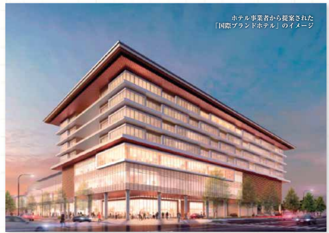
ホテル事業者から提案された「国際ブランドホテル」のイメージ

県営プール跡地を活用し、国際ブランドホテルを核とした、コンベンション施設やバスターミナル、駐車場、商業施設等、奈良独自の新たな賑わいと交流の拠点を整備するプロジェクトを進めています。