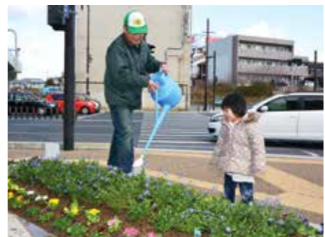
水やりにも愛情をこめて。

油阪の交差点にある花壇の世話を始めて丸4年ほどになりました。もともと大宮通りの花壇などの管理をしていたんですが、県職員にお願いされ、手を挙げて世話をすることになりました。花は県からもらっています。1年に3回ほど花の植え替えの活動をしています。日々の水や