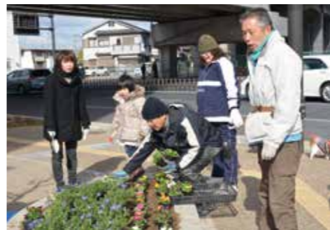
活動を次の世代へ…。

もちろん、この油阪の花壇の管理は後進を育成しながらずっと続けていくつもりです。若い世代にも加わってもらって盛り上げていきたいな。