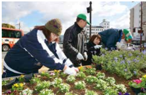
一人一人責任をもって丁寧に。