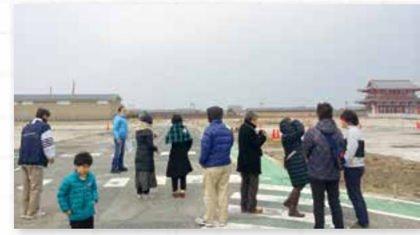
県営公園予定地などを巡る特別見学ツアーには小学生も参加!

2月14日〜22日には、「遣唐使を救え!平城京歴史館を巡るリアル謎解きゲーム」を開催。今話題の「謎解きゲーム」を完全オリジナルで実施したほか、普