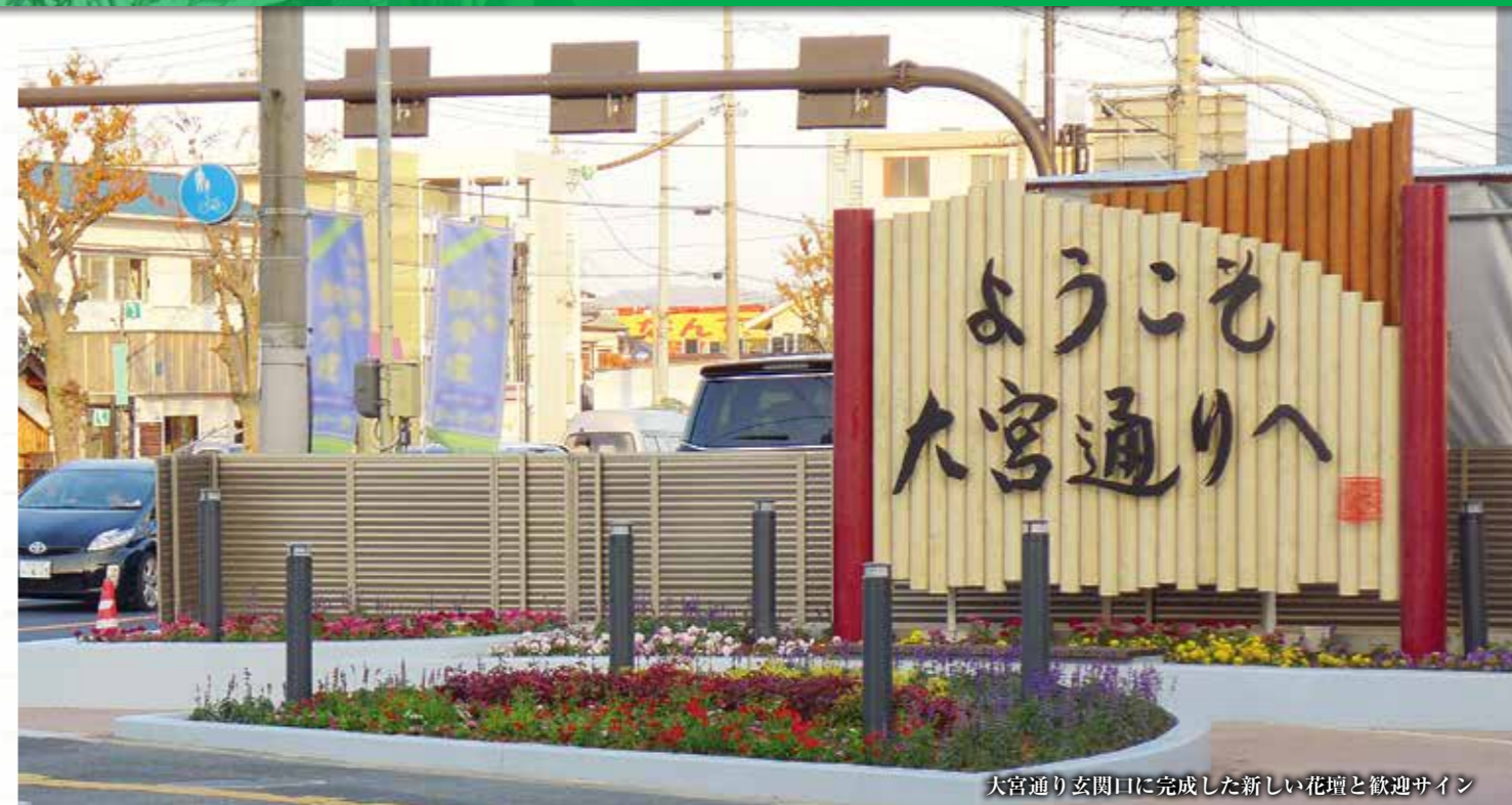
大宮通り玄関口に完成した新しい花壇と歓迎サイン