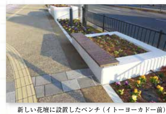
新しい花壇に設置したベンチ（イトーヨーカドー前）

前号（創刊号）で整備の様子をご紹介していた、二条大路南5丁目交差点南側の新しい花壇が、昨年11月に完成しました。「ゆめみあーと」の皆さんのアイデアを取り入れてつくった新しい花壇の中には、おもてなしの気持ちを込めた「ようこそ大宮通りへ」の歓迎サインも設置。大宮通りを奈良公園方面に向かうと真正面に見える、若草山、春日山の稜線をデザインした木製のサインで、揮毫は東大