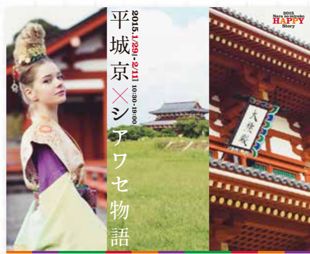
2015.1.29日・2月11日 10:30-14:30 平城京×シアワセ物語