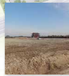
積水工場の撤去が完了した県営公園予定地

敷地内では、当面の間、土壌調査や建物を建築する予定地の文化財発掘調査を行い、調査を終えた後、本格的な整備工事を始める予定です。工事が始まるまでの間は、