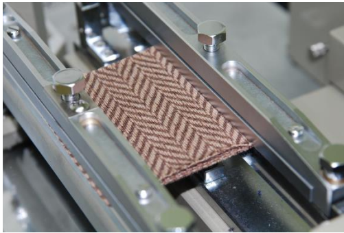
図1 引張特性の測定