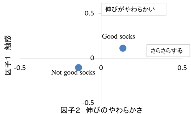
図4 各ソックスの因子得点