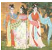
森田りえ子《撫子》 当館蔵