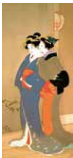
「春」上村松園 昭和11(1936)年 当館蔵 ※後期展示(2/16-3/13)

大和郡山市、宇陀市、高取町による連携展示 「大和の城と城下町」-往時の面影をしのぶ- 一般400(300)円 大・高生250(200)円 中・小生150(100)円