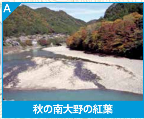
秋の南大野の紅葉