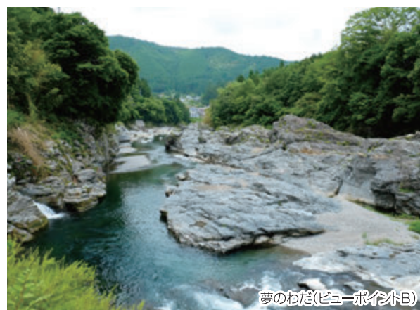
夢のわた(ビューポイントB)

この夕 柘のさ枝の流れ来ば 梁は打たず取らずかもあらむ (『万葉集』巻三ー三八六)