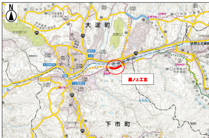
「奈良県道路網図(平24近複、第72号)を転載」