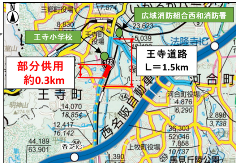
「奈良県道路網図(平26情使、第737号)を転載」