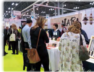
NY NOW(展示会・ニューヨーク)