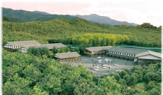
(仮称)奈良県国際芸術家村イメージ図