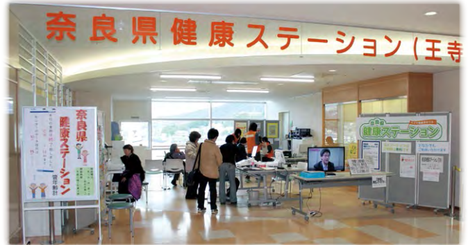
奈良県健康ステーション(王寺)