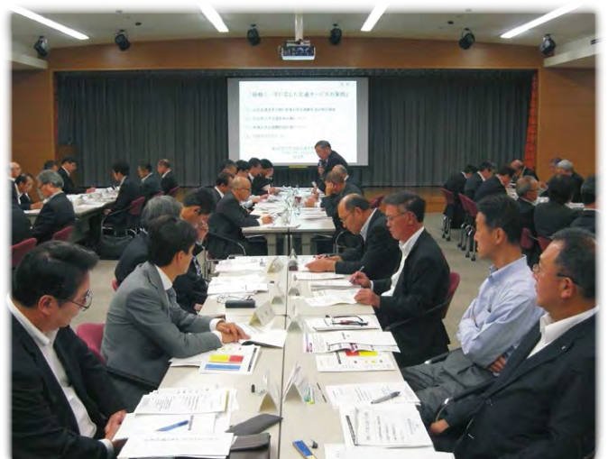
奈良県地域交通改善協議会