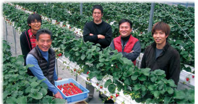
新規就農者も加わったイチゴ生産者グループ