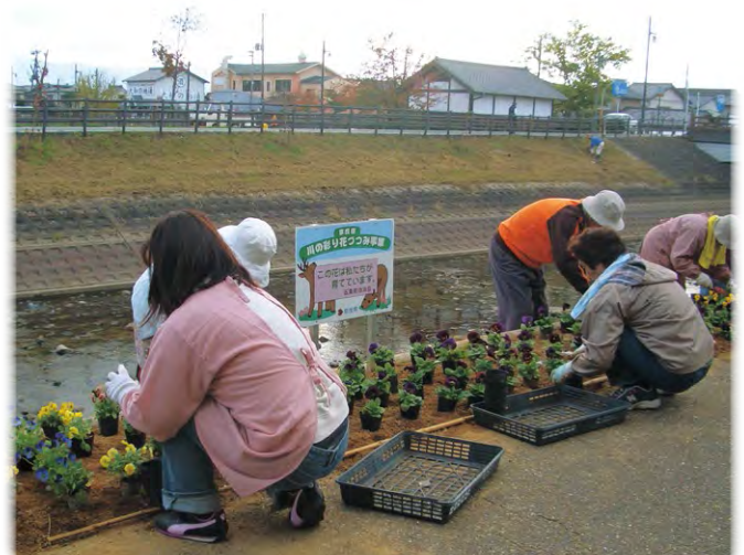
地域住民等と連携・協働した河川美化活動(秋篠川)