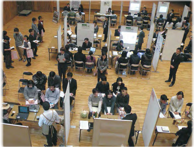
大学生対象の業界研究会(先端科学技術大学院大学)