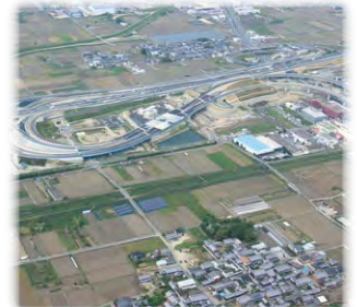
産業用地の確保の推進