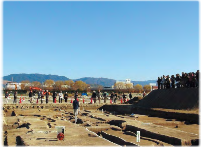
奈良県立橿原考古学研究所による平城京跡発掘調査 現地説明会