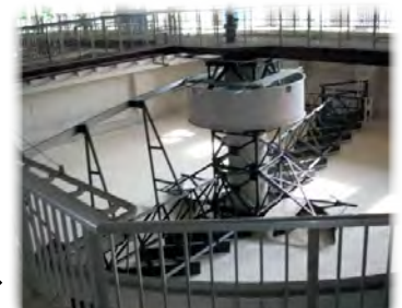
老朽化した下水道施設の更新