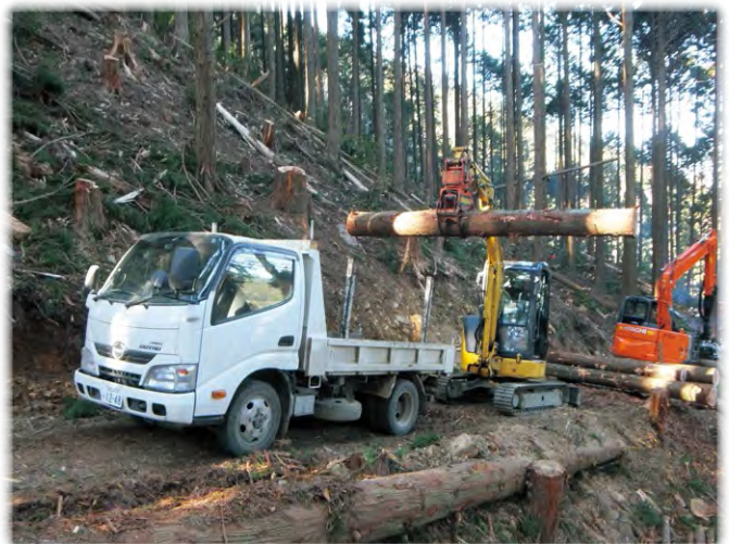
作業道と林業機械を組み合わせた効率の良い出材