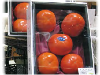
糖度測定した高品質の柿 (試験販売・東京)