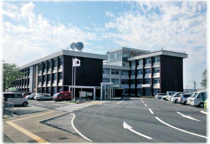
旧耳成高校校舎を橿原総合庁舎に改修