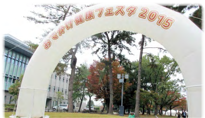
おでかけ健康フェスタ2015