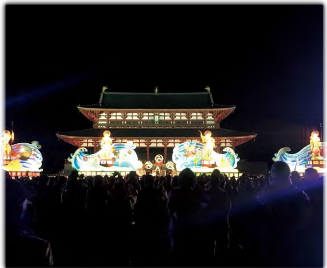
奈良大立山まつり