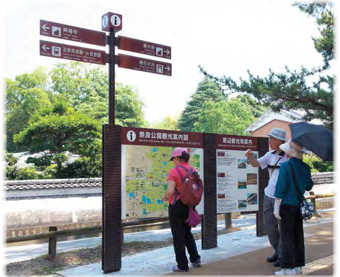
観光案内サイン(奈良公園周辺)