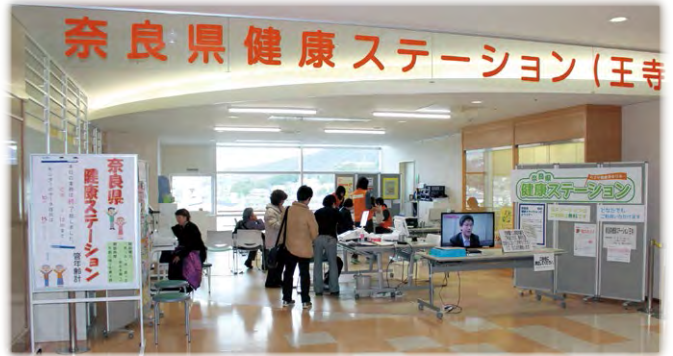
奈良県健康ステーション(王寺)