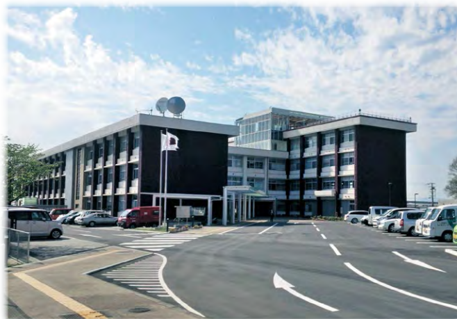
旧耳成高校校舎を橿原総合庁舎に改修