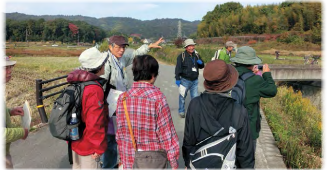
記紀・万葉ウォーク(斑鳩町)