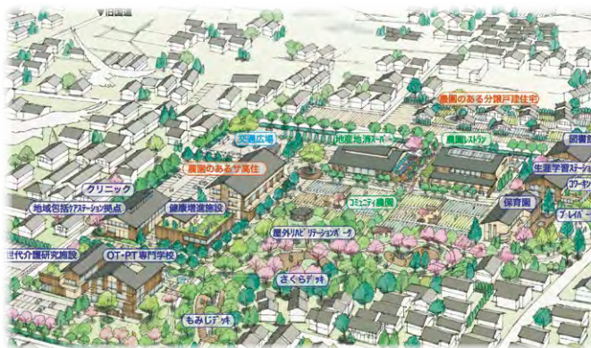
県総合医療センター跡地周辺まちづくり (アイデアコンペ最優秀作品)