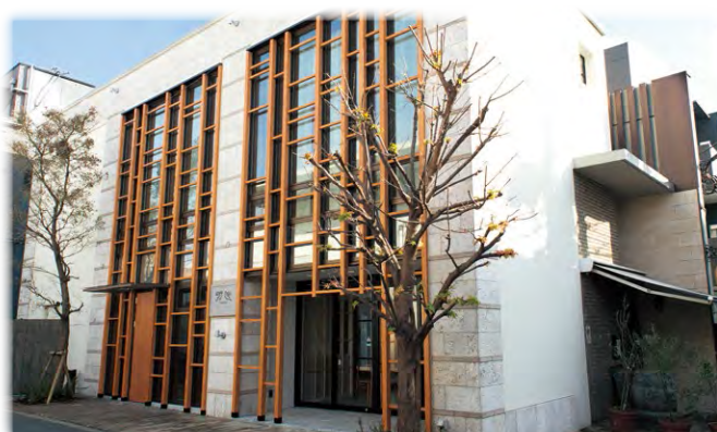
県産食材レストラン「ときのもり」(東京都白金台)