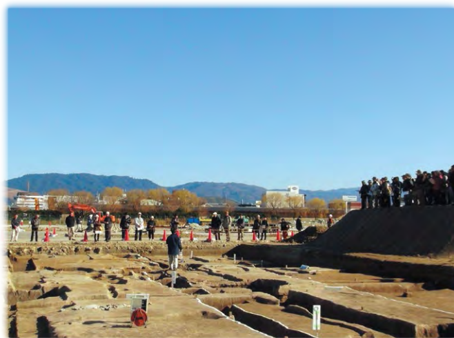
奈良県立橿原考古学研究所による平城京跡発掘調査 現地説明会