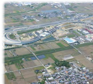
産業用地の確保の推進