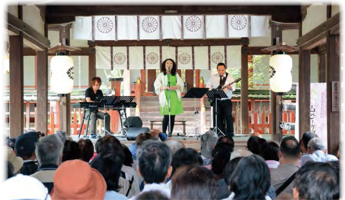
ムジークフェストなら2015