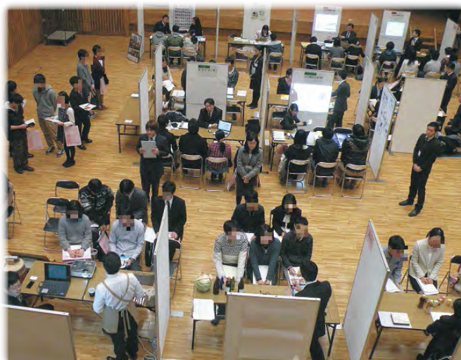
大学生対象の業界研究会(先端科学技術大学院大学)