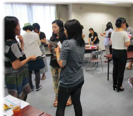
女性起業家交流会