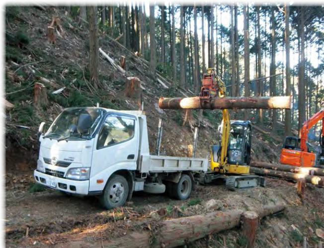
作業道と林業機械を組み合わせた効率の良い出材