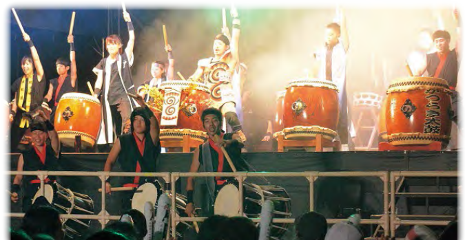
奈良県大芸術祭 オープニングイベント