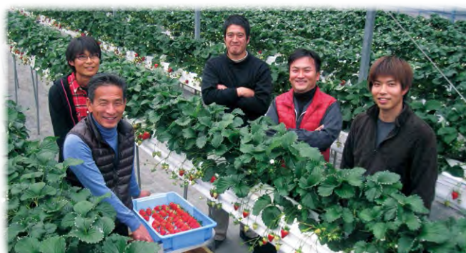
新規就農者も加わったイチゴ生産者グループ