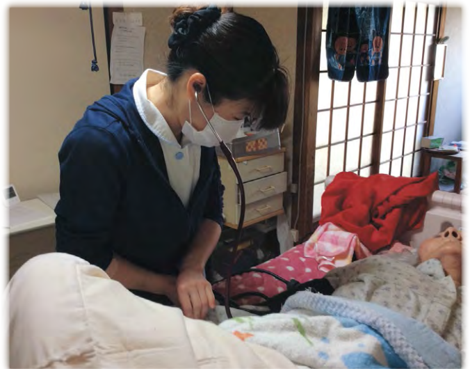
在宅療養を支える訪問看護の様子