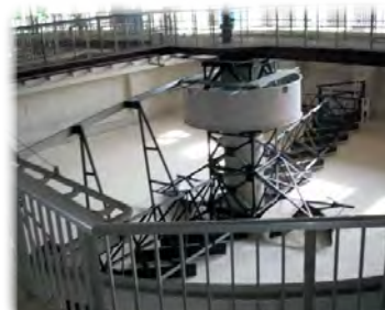
老朽化した下水道施設の更新