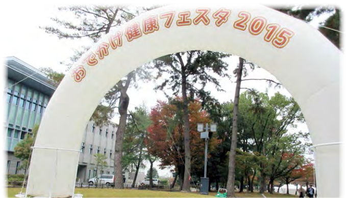
おでかけ健康フェスタ2015