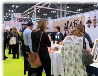
NY NOW(展示会・ニューヨーク)