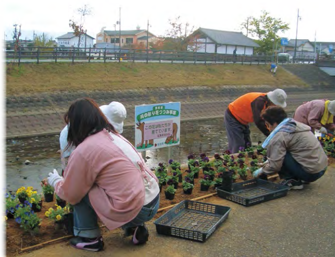
地域住民等と連携・協働した河川美化活動(秋篠川)