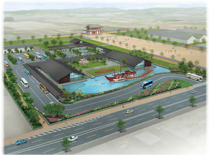
平城宮跡歴史公園 朱雀大路西側地区 整備イメージ