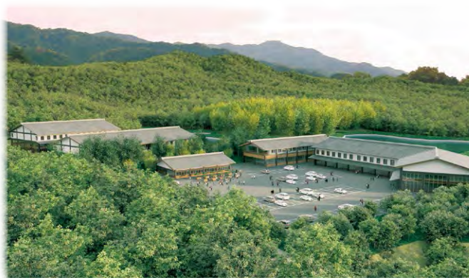
(仮称)奈良県国際芸術家村イメージ図