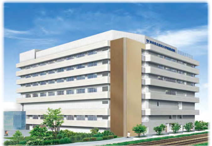
E病棟整備イメージ