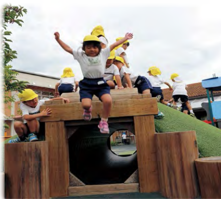
元気に遊ぶ子どもたち (片岡の里保育園)