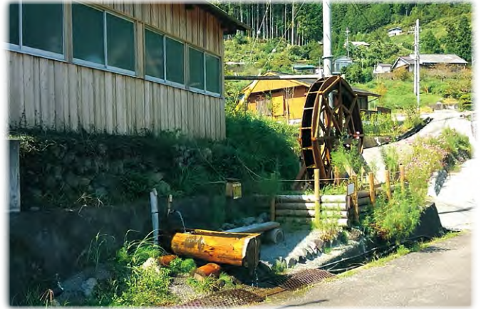
小水力発電水車(十津川村谷瀬)