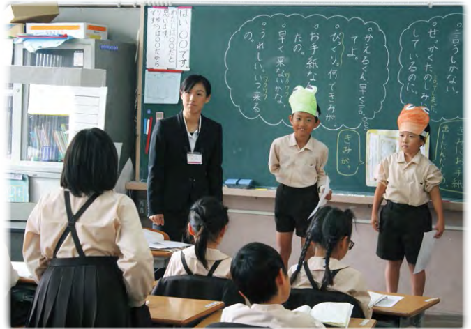
学ぶ意欲を高める若手教員の授業づくり(田原本小学校)