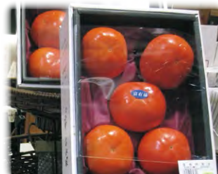
糖度測定した高品質の柿 (試験販売・東京)