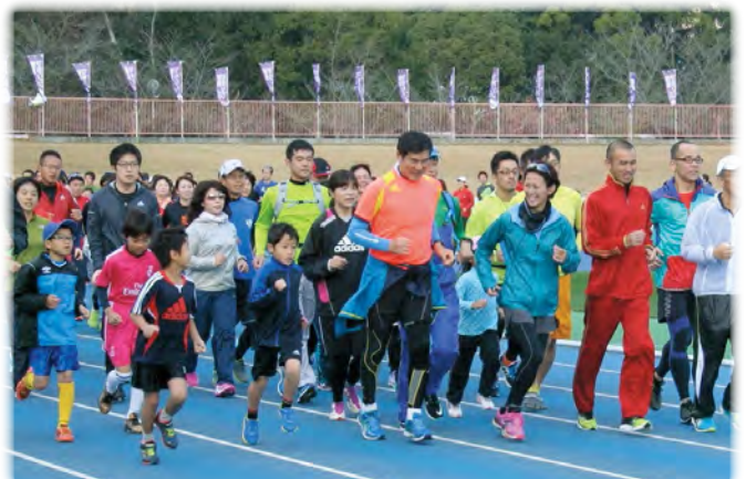
奈良マラソン2015 (有森裕子さんのランニングクリニック)