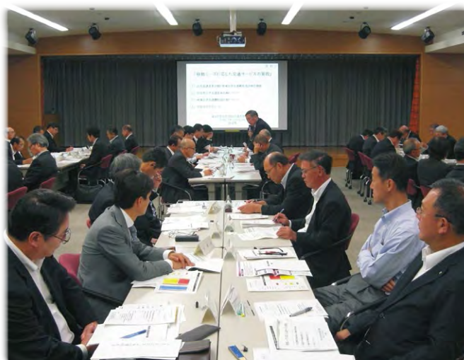
奈良県地域交通改善協議会