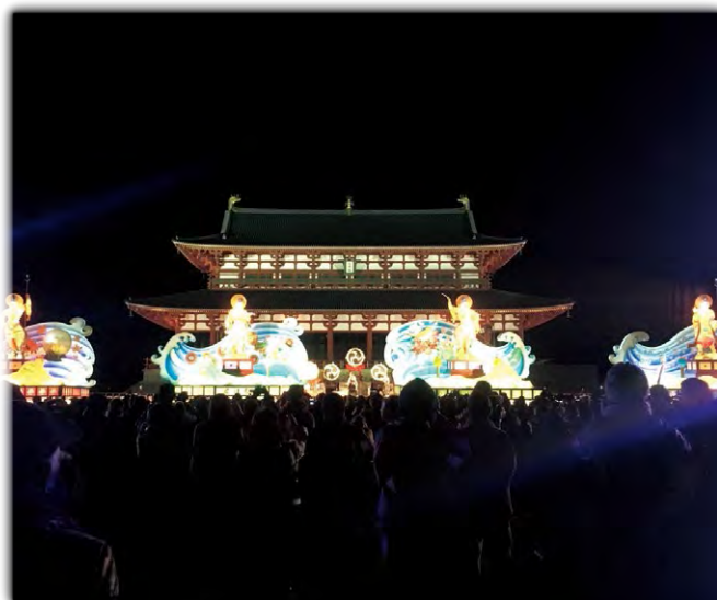
奈良大立山まつり