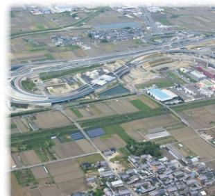
産業用地の確保の推進