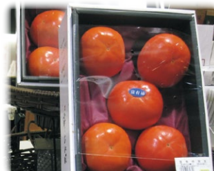
糖度測定した高品質の柿 (試験販売・東京)