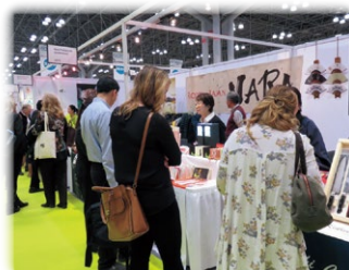
NY NOW(展示会・ニューヨーク)