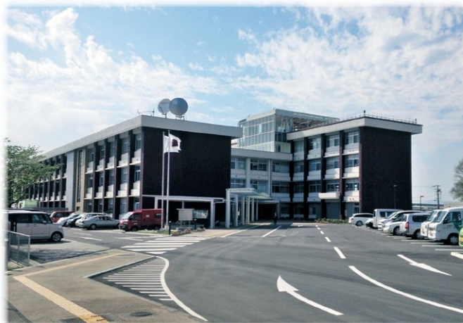
旧耳成高校校舎を橿原総合庁舎に改修