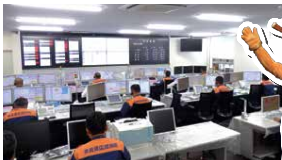
通信指令センター