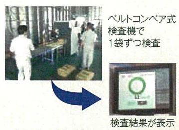
ベルトコンベア式検査機で1袋ずつ検査