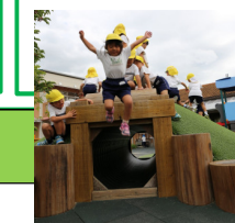
元気に遊ぶ子どもたち (片岡の里保育園)