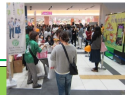
地域での子育て応援の機運醸成のための啓発イベント (イオンモール大和郡山)