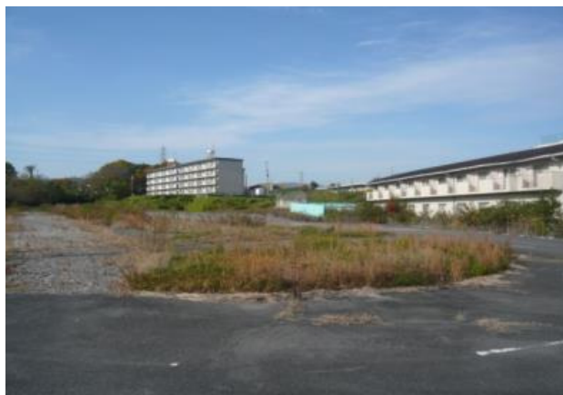
西の京自動車学校跡地 外

西の京自動車学校跡地等の県有地において、新奈良県総合医療センター関連施設(職員宿舎・院内保育所)の整備に併せて、周辺のまちづくりに資する機能を、民間事業者の提案により整備