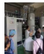
エネルギーパークバスツアー