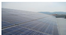
太陽光発電のイメージ

再生可能エネルギーの活用により、エネルギー利用の効率化を図るため、郡山総合庁舎及び橿原総合庁舎の屋上に太陽光発電装置を設置