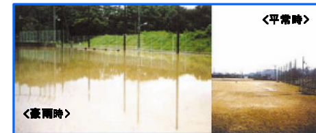
雨水貯留浸透施設