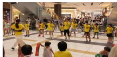
県民向けPRイベント(イオン大和郡山)