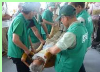
避難所訓練(大和高田市)