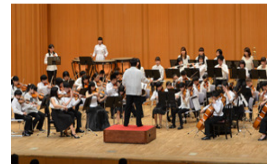
県立ジュニアオーケストラ