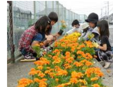
住民参加による植栽等河川美化活動