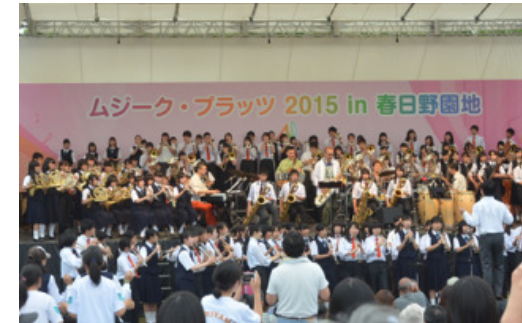
ムジークフェストなら 2015