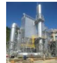
バイオマス発電所