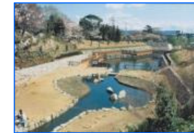
ため池の治水利用