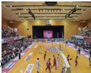
バンビシャス奈良 (プロバスケットボールチーム)