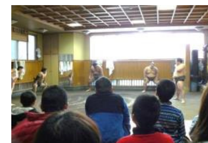
相撲部屋との交流ツアー (高砂部屋)