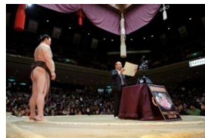
大相撲奈良県知事賞贈呈