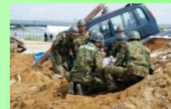
防災総合訓練(大和高田市)