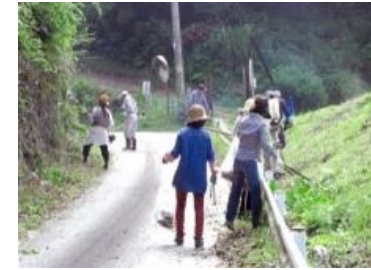
住民参加による草刈