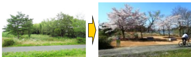
水上池の植栽整備