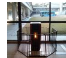
ペレットストーブ(県庁)