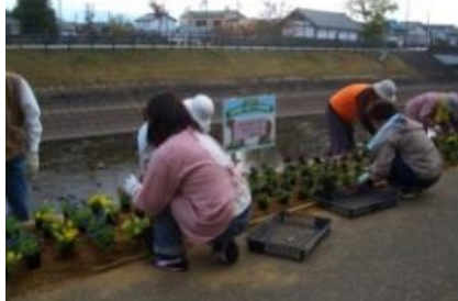
河川美化活動(秋篠川)