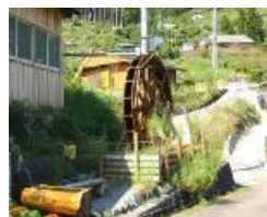
小水力発電のイメージ