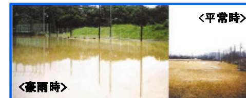
雨水貯留浸透施設