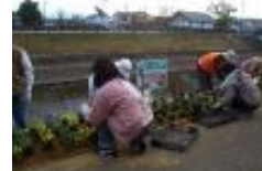
河川美化活動(秋篠川)