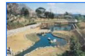
ため池の治水利用