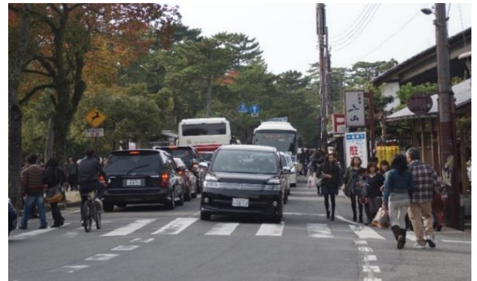
大宮通りで車両と歩行者の動線が近接する園路