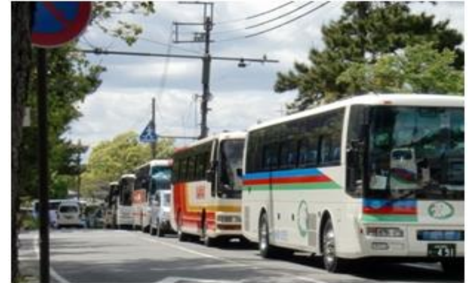
大宮通りで発生している観光バスの渋滞