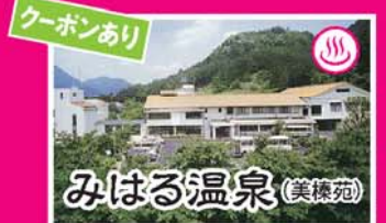
みはる温泉(美穂苑)

4月上旬に紅白のシダレザクラが小さな境内いっぱいに咲きこぼれます。全国的にも珍しい小糸シダレザクラは樹齢約300年と言われる古木。また、30本もの紅シダレザクラが美しい色彩を添えます。宇陀川対岸の崖壁に刻まれた総高13.8m日本最大級の弥勒菩薩像を背に、春の訪れとともにその美を照らします。ライトアップあり。 【拝観料】400円 【駐車場】あり 【TEL】0745-92-2220