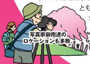
写真家御用達のロケーションも多数

大化の改新に尽くした藤原鎌足公を祀る神社。極彩色で豪華な社殿を彩るように、山桜・染井吉野・枝垂れ桜・八重桜など約500本が花を咲かせます。また、樹齢600年のウスズミザクラ「小つづみ桜」は市の天然記念物。 【拝観料】500円 【駐車場】無料 【TEL】0744-49-0001