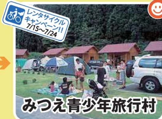
みつえ青少年旅行村

大自然に囲まれ、昔懐かしき木造のたたずまいを今に残すみつえ体験交流館。ももとは小学校だった建物を改築した、交流と憩いの空間です。陶芸、木工、竹細工、ガーデニングなどを家族や仲間と楽しく学ぶことができます。(要予約) 【定休日】火(祝祭日の場合翌日) 【TEL】0745-95-3737