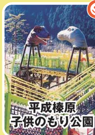
平成榛原 子供のもり公園

室生ダムの上流宇陀川沿いにある公園。水や森の役割を映像で楽しく学べる「森の館」、遊具の充実した「森の空中回廊」、バーベキューやキャンプもできるゾーンもあり、一日中楽しむことができます。【TEL】0745-82-7411