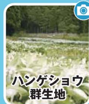
ハンゲショウ 群生地

7月初旬から8月にかけて、白い絨毯を敷きつめたような、ハンゲショウの群生地を見ることができます。