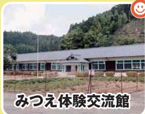
みつえ体験交流館

大自然に囲まれ、昔懐かしき木造のたたずまいを今に残すみつえ体験交流館。ももとは小学校だった建物を改築した、交流と憩いの空間です。陶芸、木工、竹細工、ガーデニングなどを家族や仲間と楽しく学ぶことができます。(要予約) 【定休日】火(祝祭日の場合翌日) 【TEL】0745-95-3737