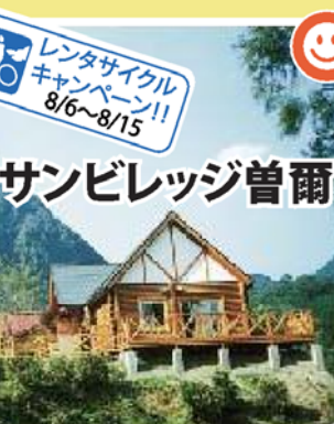
サンビレッジ曽爾

清冽な滝とエメラルドグリーンの淵が連続し、大小の岩が渓谷の美をかたちづけています。昔、この滝に清浄坊という仏寺があって、修験者がこの滝で行水して身をきよめ、水煙大不動明王の霊を仰いだと伝えられています。近くに「長走りの滝」もあります。