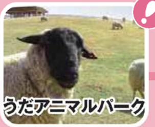
うだアニマルパーク

広々とした園内に牛や羊が草を食むのどかな動物公園。小高い丘に登れば風が心地良く、大宇陀の自然豊かな風景をゆったりと楽しむことができます。動物学習館では、バターづくりなどの体験(先着順)や、動物のことが楽しく学べるコーナーもあります。 【TEL】0745-87-2520