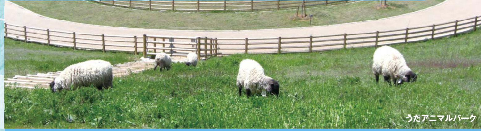
うだアニマルパーク