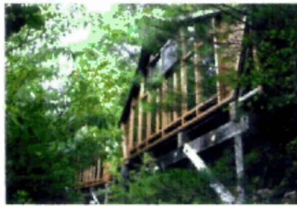
第2サイト 大テント