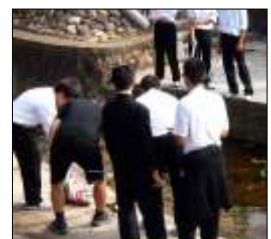
ボランティア清掃