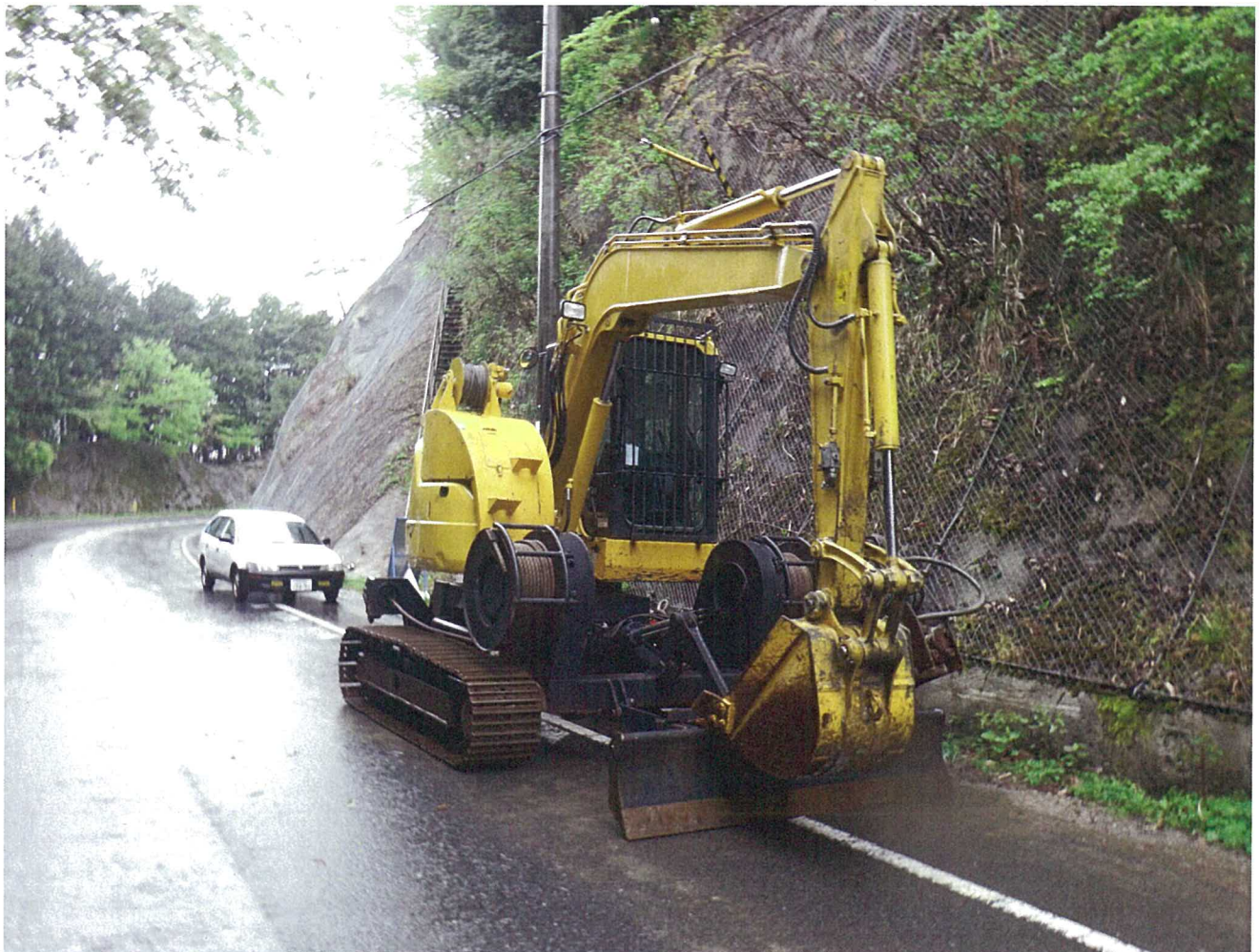
現地で使用するクライミングマシーン