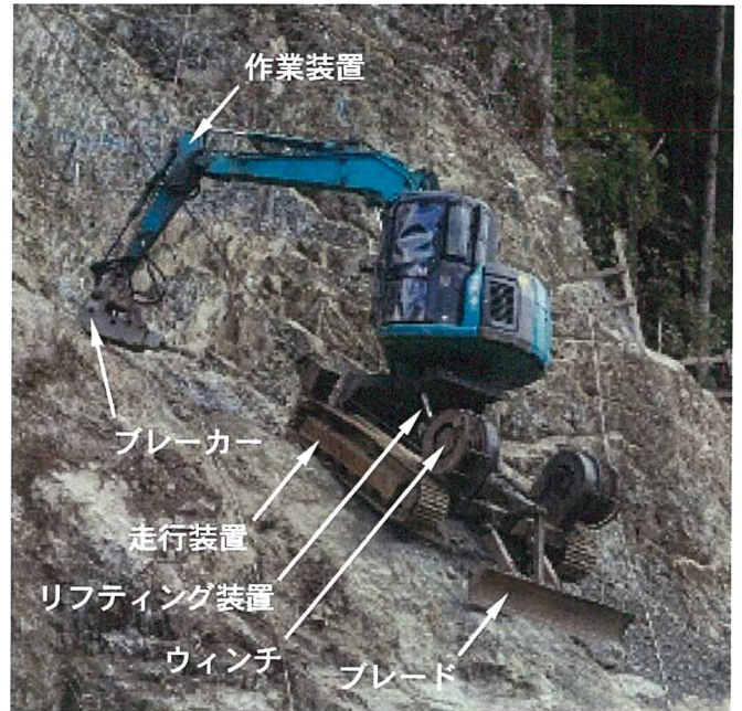
掘削機の概要写真