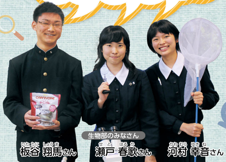
生物部のみなさん

奈良高校の良いところは、魅力的で个性的な人がたくさんいて、生徒がお互いの個性を認め合っているところです。