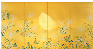
加山又造<月と秋草>当館蔵