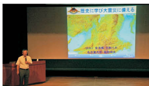
昨年度開催した 講演会のようす

申 ハガキかFAXに住所・氏名・年齢・電話番号・ 講演会名を記入し、7/19(火)までに下記へ。