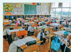
昨年のナラ・シェイクアウトのようす (広陵町立真美ヶ丘小学校)

訓練日時には、いっせいに上記①②③の身をまもるための安全確保行動をとってみましょう!