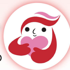
犯罪被害者等支援 シンボルマーク 「ギョっとちゃん」

この条例により、これらの方々が悩みをひとりで抱え込まず、早急に平穏な生活を営むことができる社会の実現をめざします。