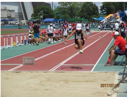
より遠く!(走り幅跳び)