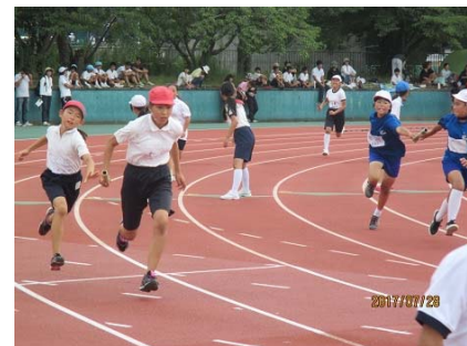
みんなの気持ちをバトンにこめて (4×100mリレー)