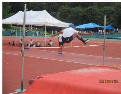
より高く!(走り高跳び)