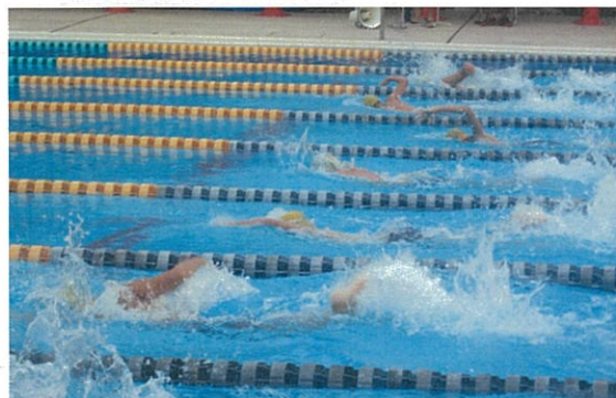
日頃の練習の成果を発揮