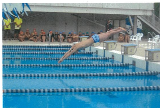
天井選手が華麗な泳ぎを披露