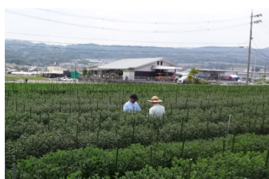
盆自然開花品種の生育調査