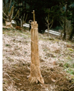
ハナモモ防寒試験（こも巻き区）