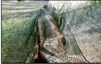
クマザサ（寒冷紗：遮光率・・・右-70%左-50%）