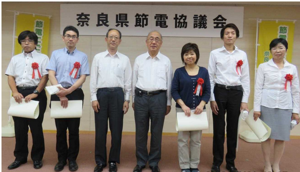
「奈良県省エネECOチャレンジ」表彰者のみなさん