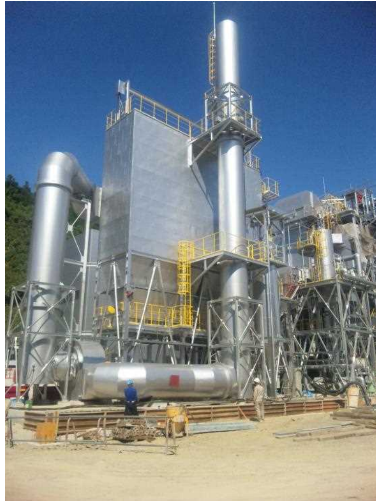
木質バイオマス発電所(大淀町内)