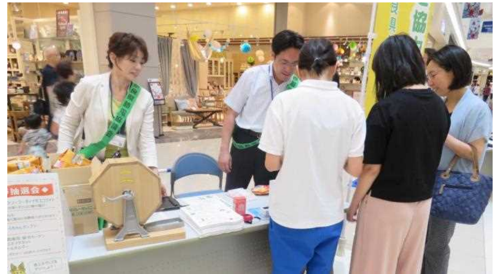
夏季省エネ・節電キャンペーン 啓発イベント(イオンモール橿原)