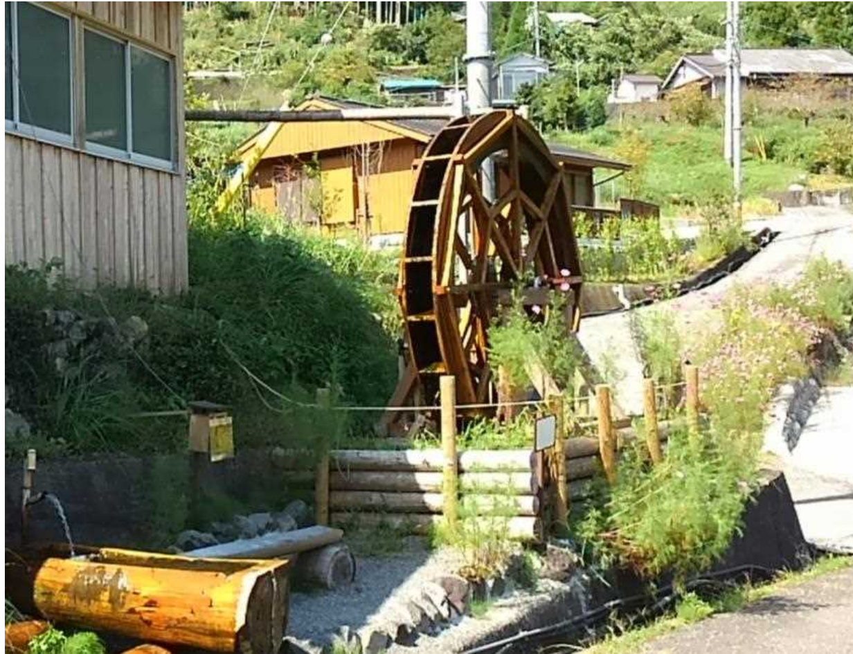
十津川村谷瀬地区の小水力発電水車