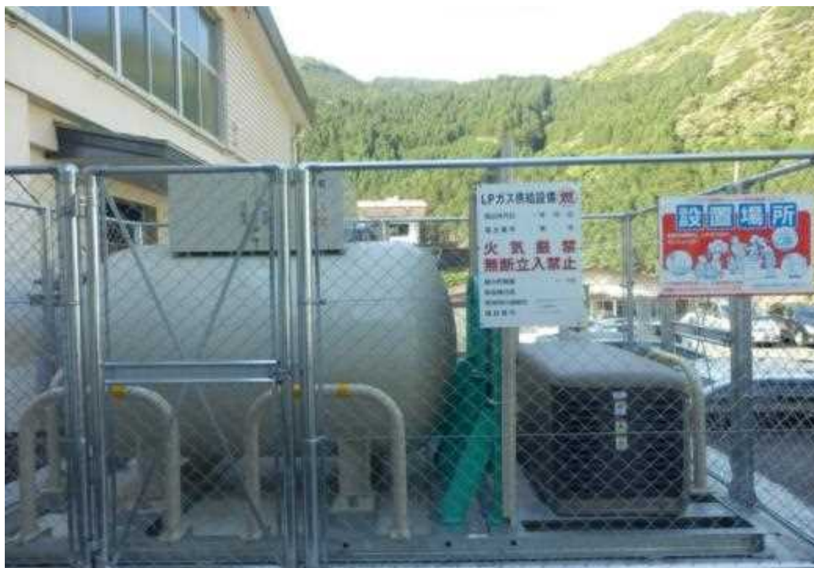
県立十津川高校(十津川村の避難所)のLPガス発電機