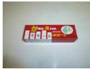
クリームポピーS(鎮痒)