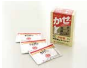
かぜロンゴールド顆粒