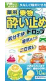
乗り物酔い止めドロップ