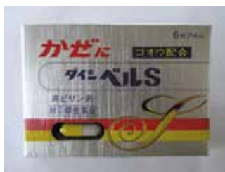
ダイシベルS (かぜ薬)