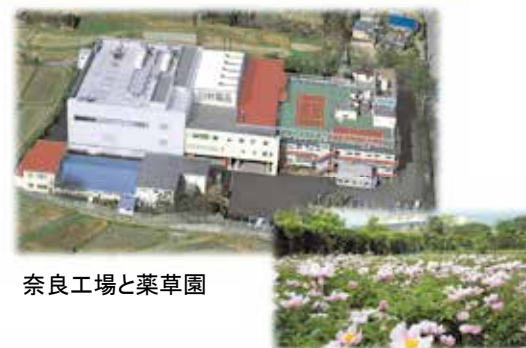
奈良工場と薬草園