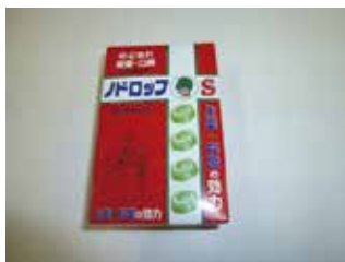
ドロップス(口腔殺菌)