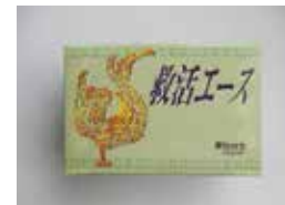
救活エース (生薬強壯剤)