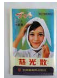
慈光散 (頭痛・肩こり・歯痛に)