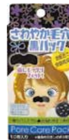
さわやか毛穴黒 パック