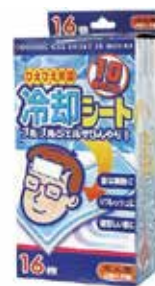
「ひえひえ天国」 冷却シート