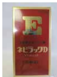
ネビラックD (手足のしびれ・冷えに)