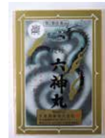
虔修六神丸 (強心薬)