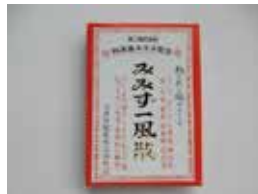
みみずー風散 (鎮痛解熱薬)

<購入先> http://www.tenshindo.co.jp でインターネット販売中