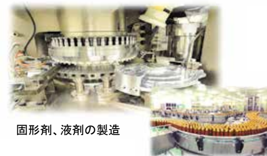
固形剤、液剤の製造