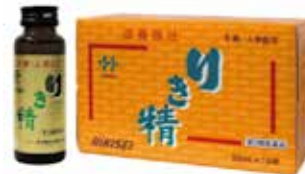
「りき精」 滋養強壮ドリンク剤