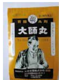
胃腸良剤大師丸 (下痢・食あたりに)