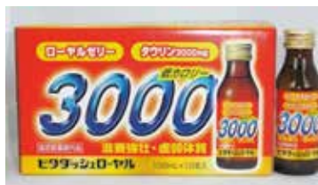
ビタダッシュローヤル