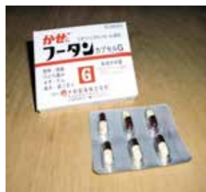
フータンカプセルG