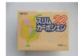
スリムカーボジェン22 (ダイエットサプリメント)