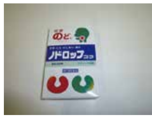
ドロップコフ(鎮咳去痰)