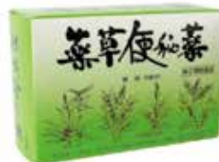
「薬草便秘薬」 生薬のみの便秘薬