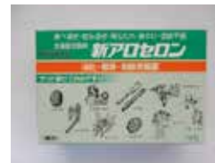
新アロセロン (消化・健胃・制酸胃腸薬)