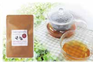
大和当帰葉紅茶ブレンド