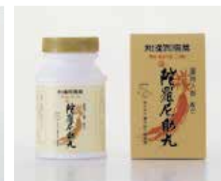
薬用人参配合 陀羅尼助丸