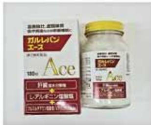
ガルレバンエース