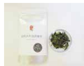
焙煎大和当帰葉茶