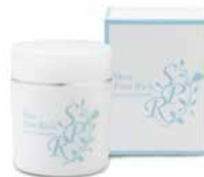
スキンピュアリッチ