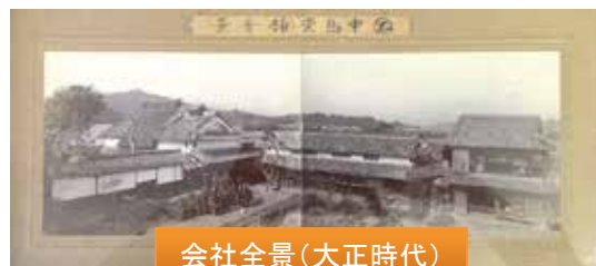
会社全景(大正時代)