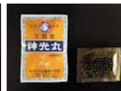
和漢胃腸薬 神光丸