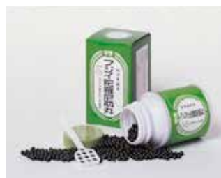
フジイ陀羅尼助丸