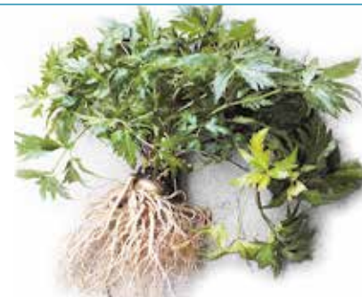
栽培している大和当帰

与地区农业生产者共同设立,从事挑选水果甄选,发货,食品加工以及销售等一条龙服务。此外,还在当地经营梅,柿子,蔬菜中心,以及从事当地蔬菜的生产活动。五条地区有栽培天然药材的传统,此外也从事天然药材大和当归的栽培及商品开发活动。