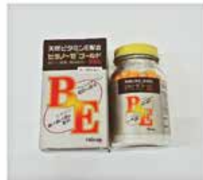
ビタノーゼゴールド