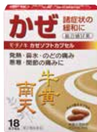
カゼソフトカプセル