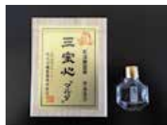
どうき・息切れ・気つけに 三宝心「マルタ」

・奈良市内の販売取り扱い店舗 ウェルシア薬局・ドラッグストア木の うた・ココミンドラッグ・ダイコクド ラッグ・サンドラッグ・ドラッグセイム ス