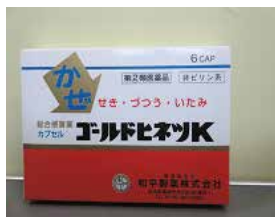
ゴールドヒネツク