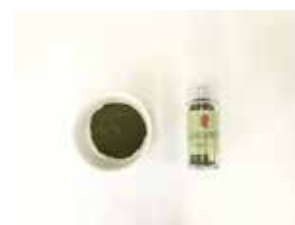
大和当帰葉粉末 タイプ