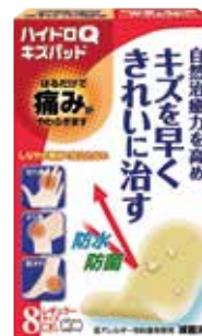
ハイドロQキズパッド