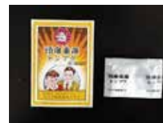
痛み止め 頭痛歯痛トンプク