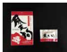
生薬配合かぜ薬 風天狗