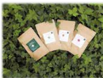
大和エンジェルグラスティー (ストレート)