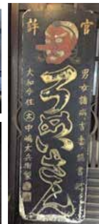
薬免許(慶応年間) 得意帳(天保年間) 看板(元禄年間)