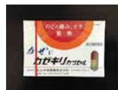
総合感冒薬 カゼキリカプセル