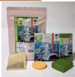
徐福蓬萊本舗シリーズ