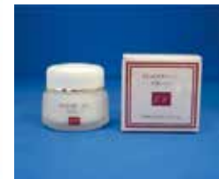
プラセンタ EXクリーム