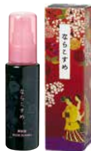
ならこすめ エッセンス