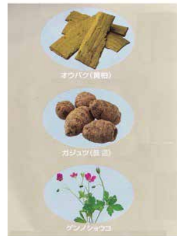
原料として、健胃剤(オウバク、ガジュツ)整腸剤(ゲンノショウコ)配合

<購入先> 電話 0747-64-0848 Email darani-y@m5.ne.jp でお願ひします。