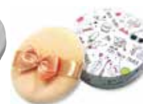
クラブ エアリータッチ パウダー