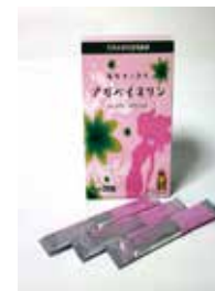
アガベイヌリン顆粒