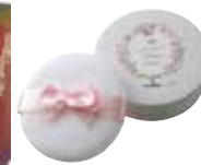
クラブ すっぴん パウダー