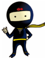
マスコットキャラクター さんこう丸