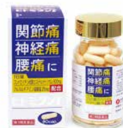
ヒトミタンf (関節痛・神経痛・腰痛に)

<購入先> 株式会社ホーエイが運営するサプリの館 ( http://hoeisupple.shop25.makeshop.jp/ ) で販売中。