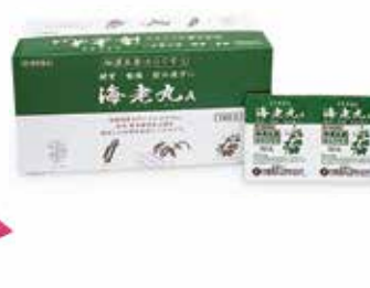
海老丸A (和漢生薬のはらぐすり)