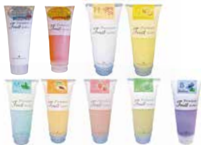
プレミアムフルーツソルベ 500g (全9種類)