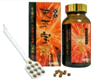
天平宝漢 (14種類の生薬配合の滋養強壮剤)