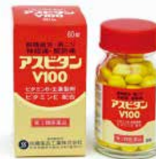
アスピタンV100 (目・腰・肩に効く ビタミンB 1 主薬製剤)