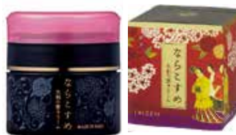
ならこすめ 大和の恵クリーム