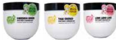
スーパースムーザー 550g (全3種類)