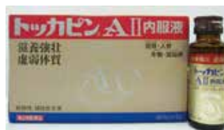
トッカピンA II 内服液