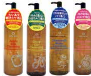
クレンジア 500mL (全4種類)