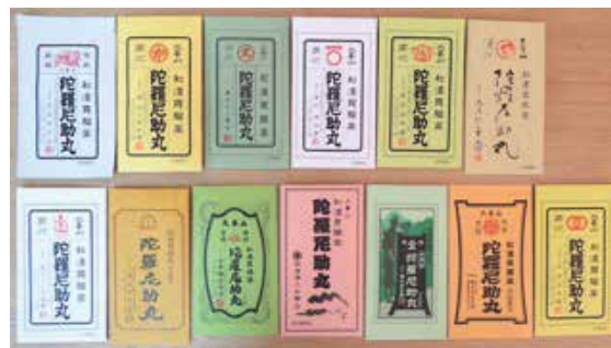
1回分ずつ個包装した製品。瓶入、徳用もあります。