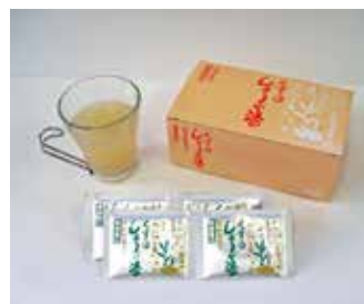
吉野本葛入りしょうが湯