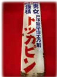
昔のホーロー看板

1931年サーブ研究所を創業、1947年金陽製薬株式会社を設立。2000年テクノ奈良工場の操業を開始しました。創業当時より医薬品、滋養強壮等の内服液剤の製造をしており、現在も本社を始め2つのGMP工場でドリンク剤を中心に医薬品から入浴剤、健康食品などを生産しております。当社は、医薬品メーカーとして半世紀を超える歴史を歩みこれからも絶えず品質の向上と新製品開発に努力をかさねてまいります。