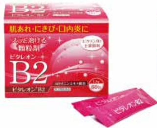
ビタレオンB2 (薏苡仁エキス配合 肌あれ・ にきび・口内炎に)