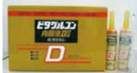
ビタグルコン内服液D II