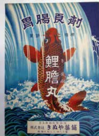
昔の置き薬の預け袋