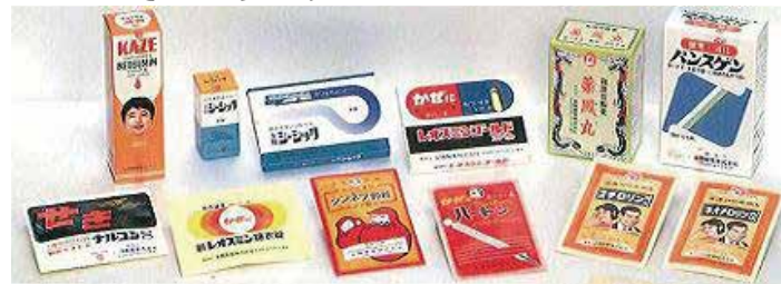
金陽製薬株式会社で1970年代に発売されていた配置薬