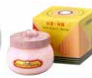
クラブ ホルモン クリーム