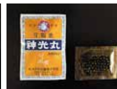
和漢胃腸薬 神光丸