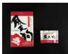
生薬配合かぜ薬 風天狗