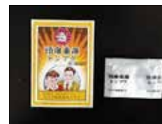
痛み止め 頭痛歯痛トンプク