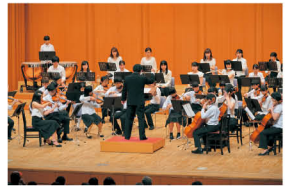
奈良県立ジュニアオーケストラ