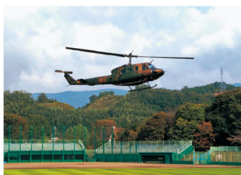
ヘリコプターによる救助訓練

五條市上野公園では、被災地での救出・救助訓練、復旧活動訓練や医療救護・搬送訓練のほか、自主防災組織や住民の参加による避難所開設・運営訓練や避難所医療訓練を行いました。橿原市橿原運動公園では、被災地での救出・救助訓練や医療救護・搬送訓練を行いました。