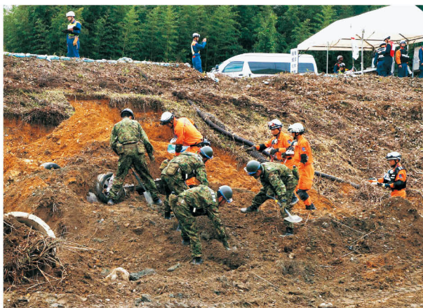
斜面崩落・土砂災害救出訓練