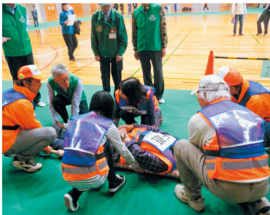
避難所での簡易担架作製訓練

今回は大規模地震を想定し、地域住民、警察、消防、自衛隊、ライフライン機関、医療関係機関などの104団体、約2,500人が参加しました。