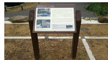
平面表示のイメージ