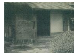
山口家南都別邸茶室の往時の姿を伝える古写真