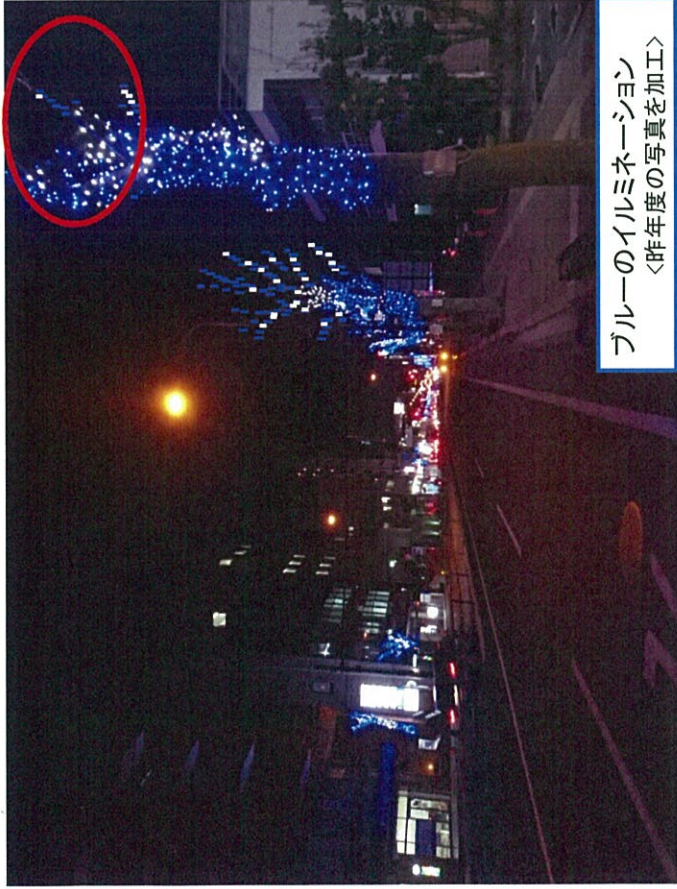
ブルーのイルミネーション <昨年度の写真を加工>