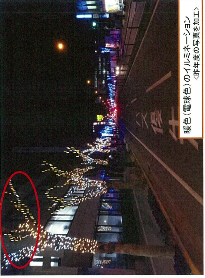
暖色(電球色)のイルミネーション <昨年度の写真を加工>