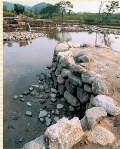
あすかえんちこう 飛鳥苑池遺構