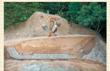
けんごしづかこふん 牽牛子塚古墳